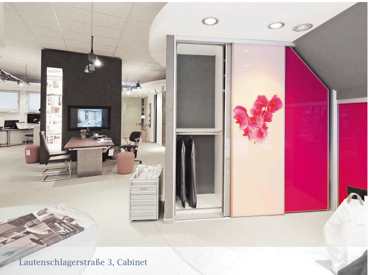
Lautenschlagerstraße 3, Cabinet