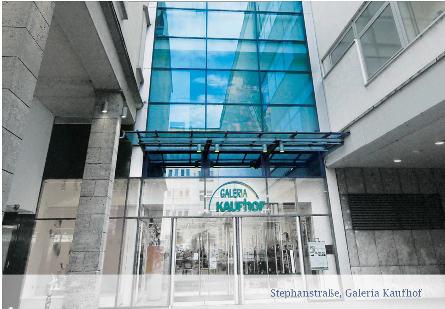
Stephanstraße, Galeria Kaufhof

Geringfügige Abweichungen sind auf Rundungsdifferenzen zurückzuführen.