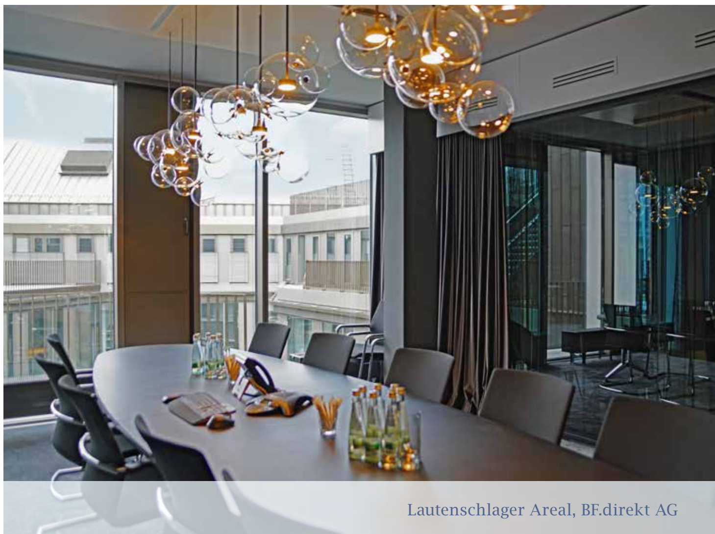
Lautenschlager Areal, BF.direkt AG

Geringfügige Abweichungen sind auf Rundungsdifferenzen zurückzuführen.