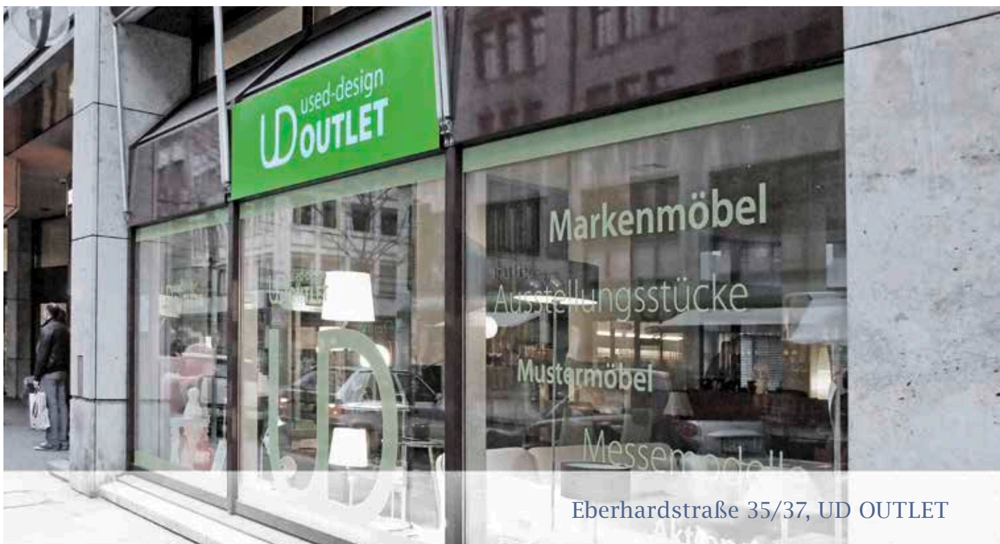
Eberhardstraße 35/37, UD OUTLET

Geringfügige Abweichungen sind auf Rundungsdifferenzen zurückzuführen.