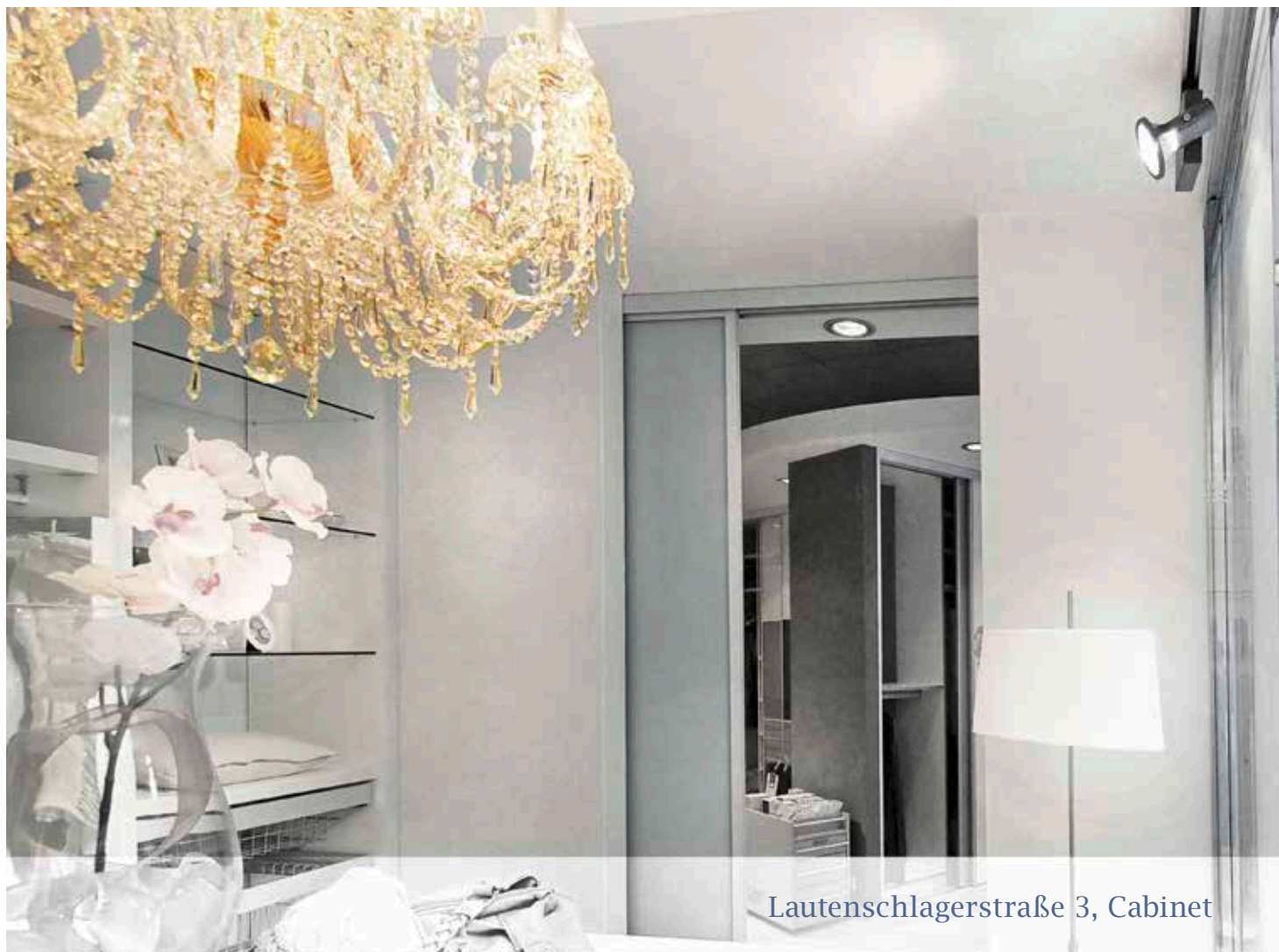
Lautenschlagerstraße 3, Cabinet

Geringfügige Abweichungen sind auf Rundungsdifferenzen zurückzuführen.