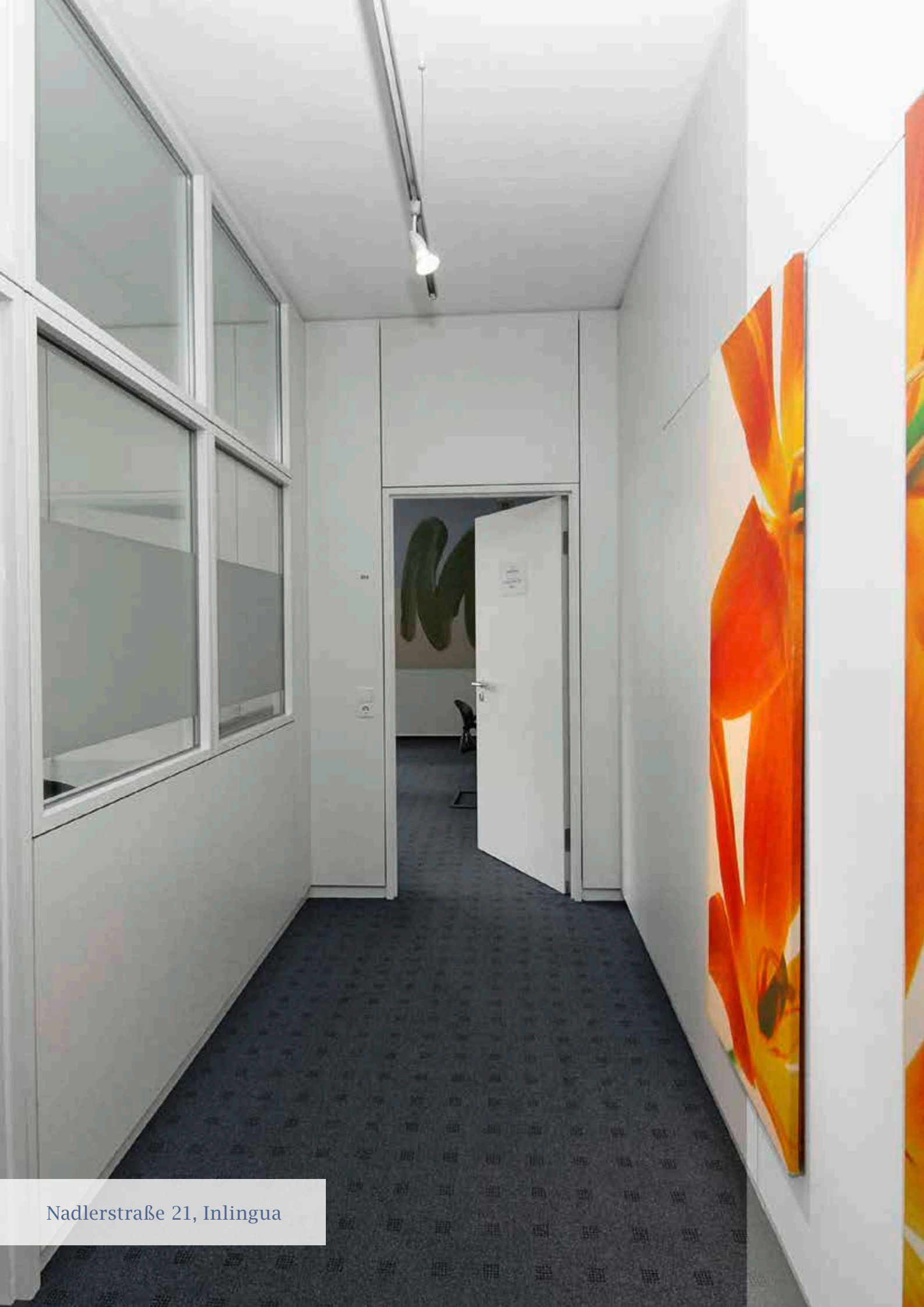
Nadlerstraße 21, Inlingua