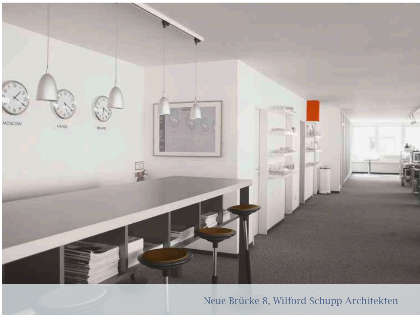
Neue Brücke 8, Wilford Schupp Architekten

Geringfügige Abweichungen sind auf Rundungsdifferenzen zurückzuführen.